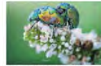
Imagen de enero. J. L. LLANO